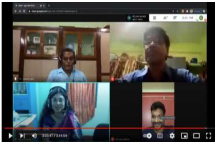
এক দিবসীয় আন্তর্জাতিক আন্তর্জালিক আলোচনাচক্র,বিষয় - চল্লিশের দশকের বাংলা উপন্যাস : ১৯৪০-১৯৪৯